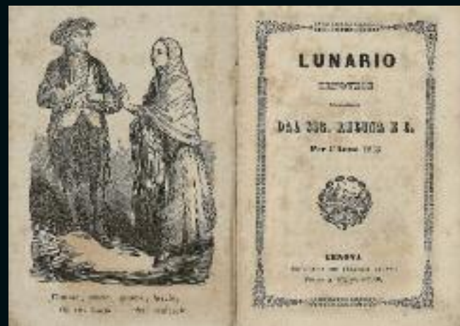
SAGEP EDITORI Catalogo della mostra Sagep Editori, Genova

Orario: lunedì e venerdì 10.00-14.00 martedì, mercoledì e giovedì 10.00-17.00 In occasione degli eventi l'orario sarà prolungato. Visite guidate gratuite: da lunedì a venerdì in data e orario da concordare (per gruppi); sabato ore 10.00 su prenotazione info: 010 537561 · www.asgenova.beniculturali.it archigenovanews@gmail.com Archivio di Stato di Genova@ASGEcomunicazione