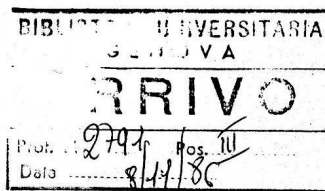
Fig. 2 - GENOVA. BIBLIOTECA UNIVERSITARIA, Archivio storico dei documenti amministrativi , Petrucciani Alberto, Posizione III, 691 (n. identificativo provvisorio), lettera.