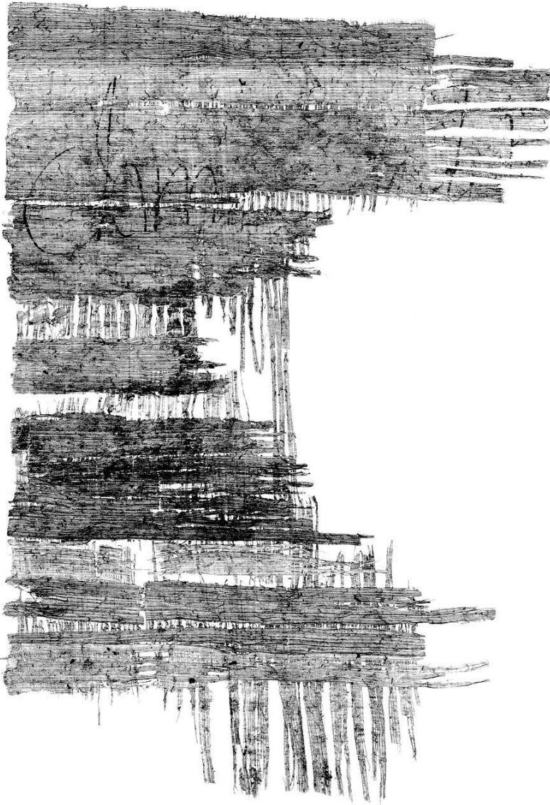
Tav. 2 – Berlin, Ägyptisches Museum und Papyrussammlung P 25673 lato ↓