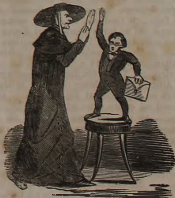
Antonelli magnetizza Pinelli.