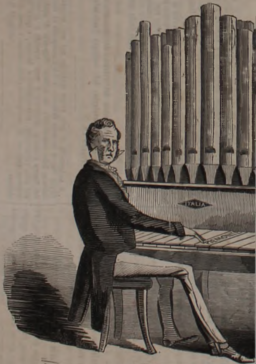
Lord Palmerston dopo averci