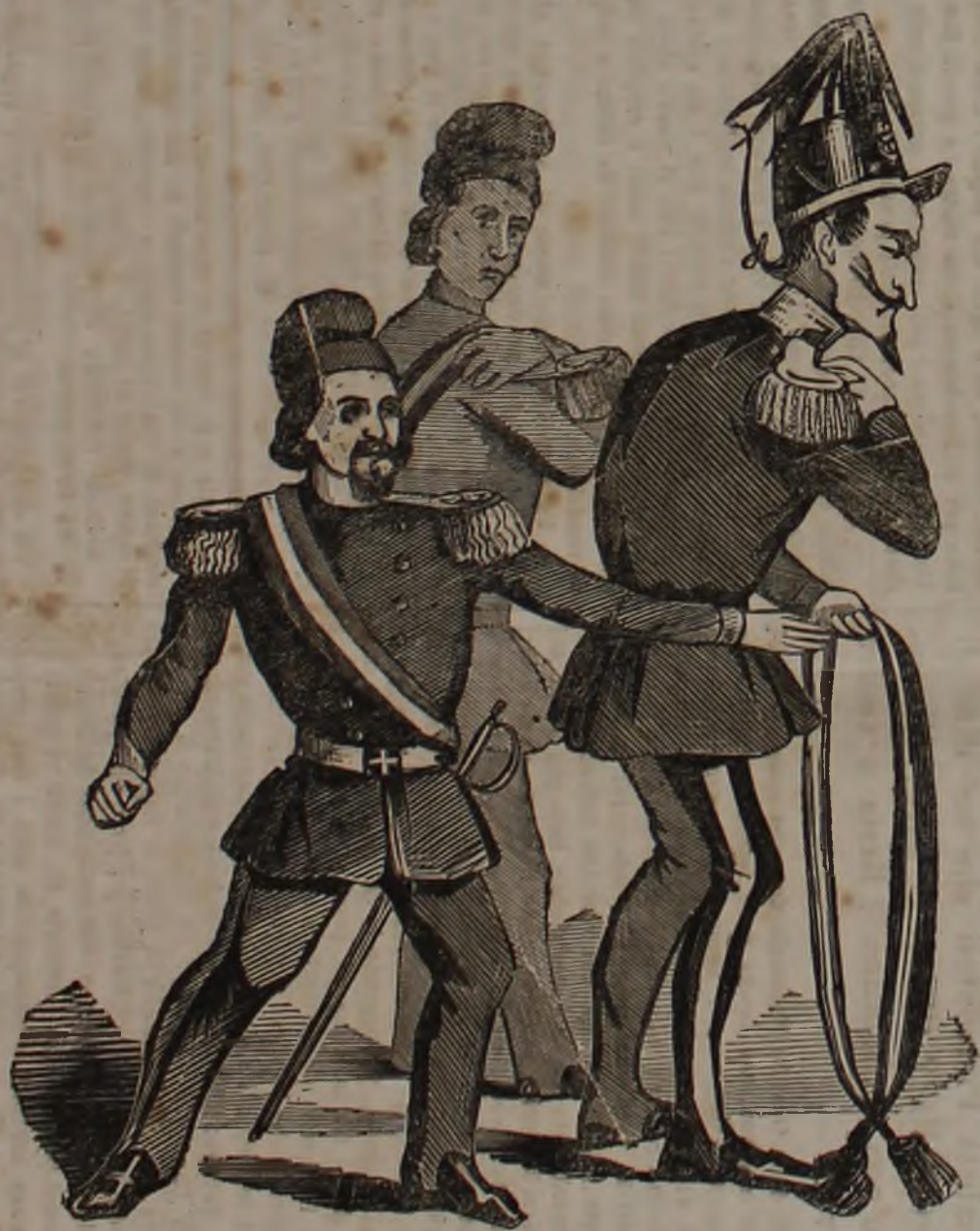
I berretti frigi sono in iscompiglio