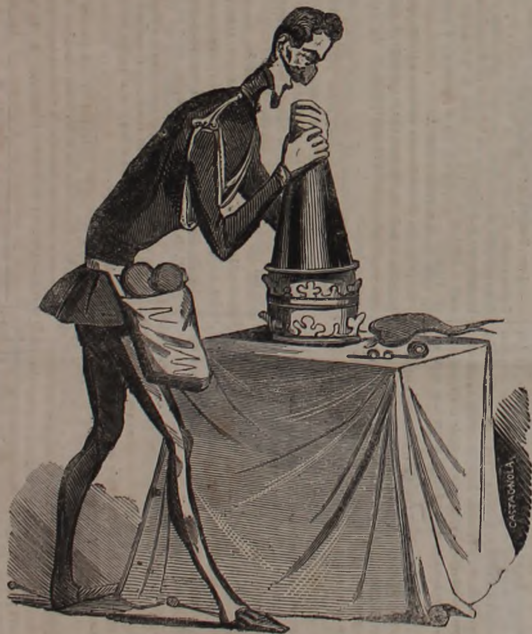
Zebedeo I. che finge, ma non vuole scamottare il cappello di Don Male-Stai.