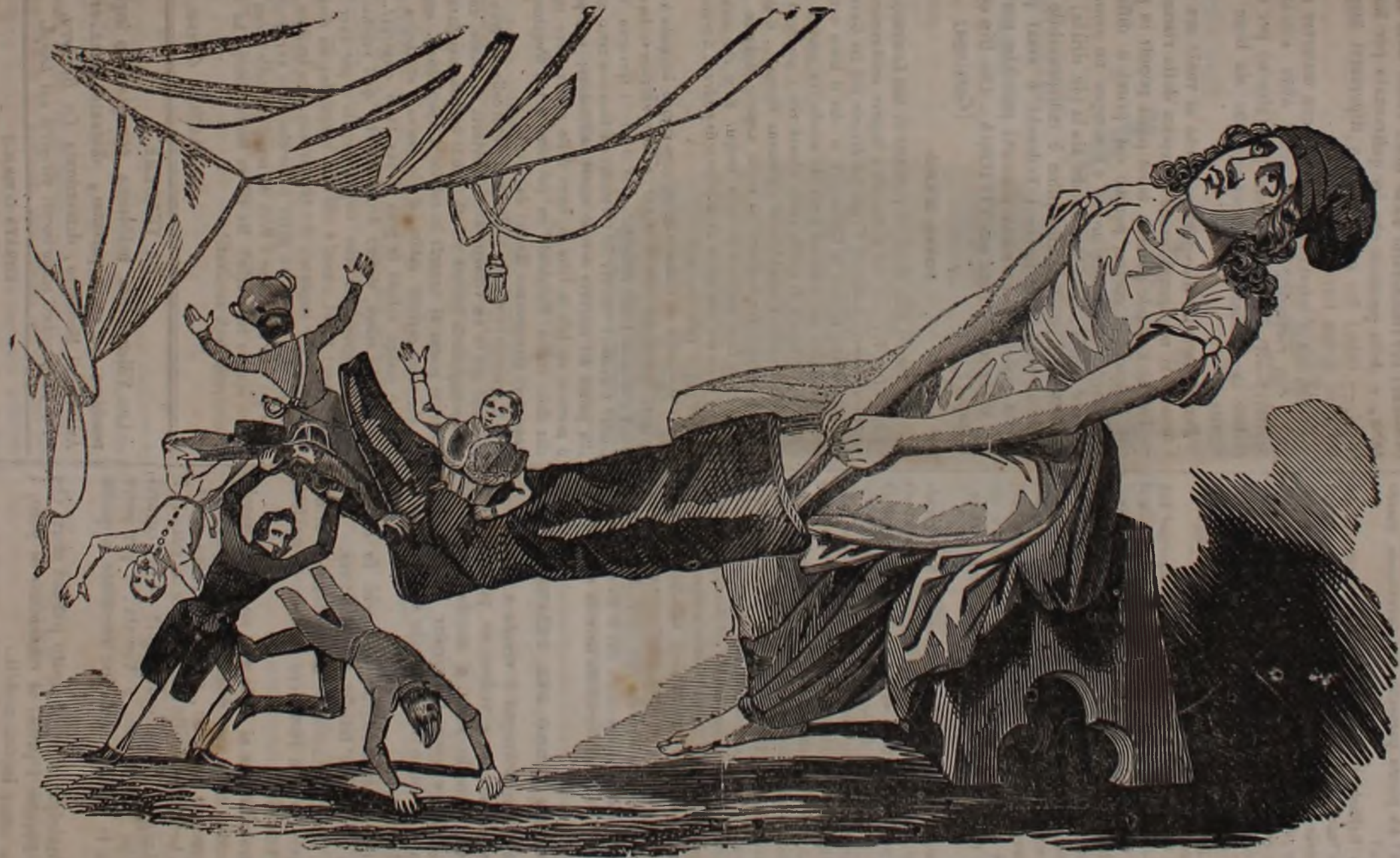
La Repubblica si calzerà sì o nò questo STIVALE?