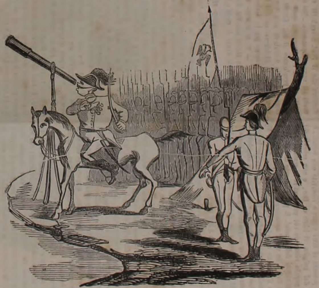
46 Punti alla Camera Inglese hanno ridotto Radeschi al 0!