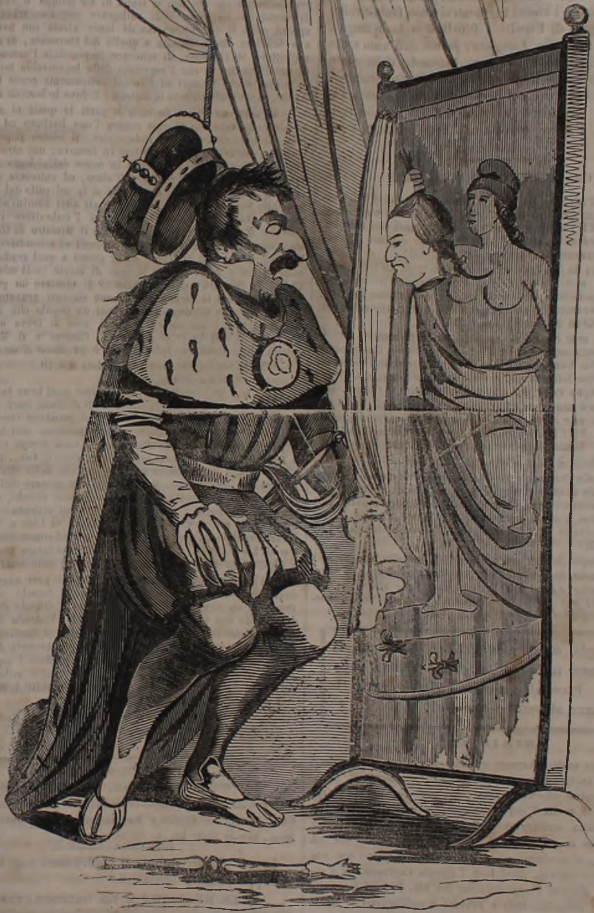
Un terribile SPECCHIO per il Malaparte!!! La testa del Capeto è un cattivo augurio pei Pretendenti.