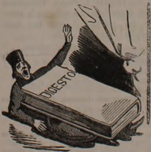
Gazzetta dei Tribunali