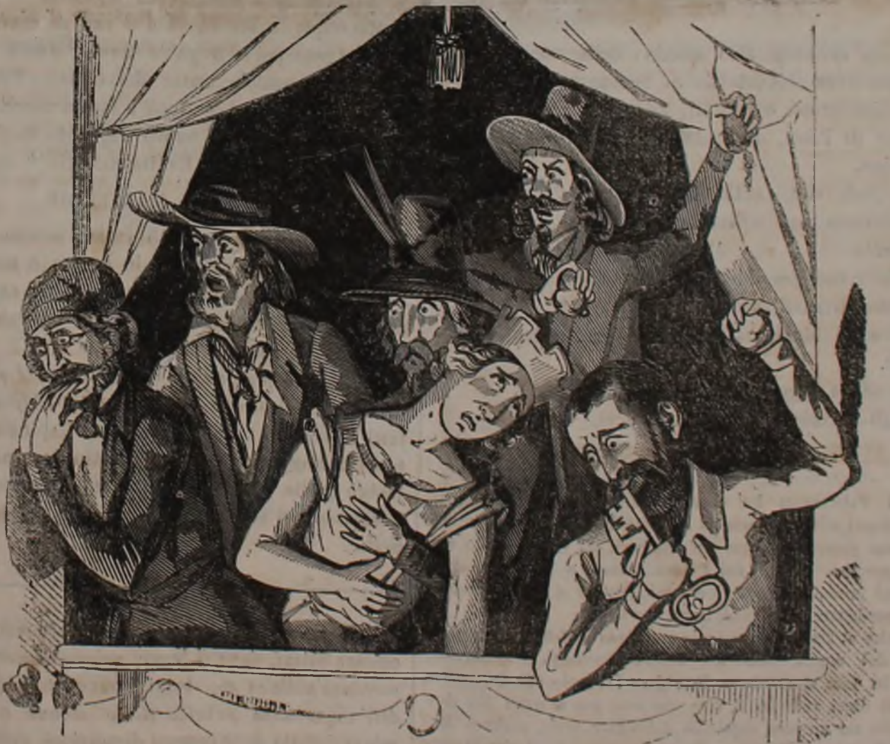
I Democratici fischiano i traditori che hanno svenata l'Italia.