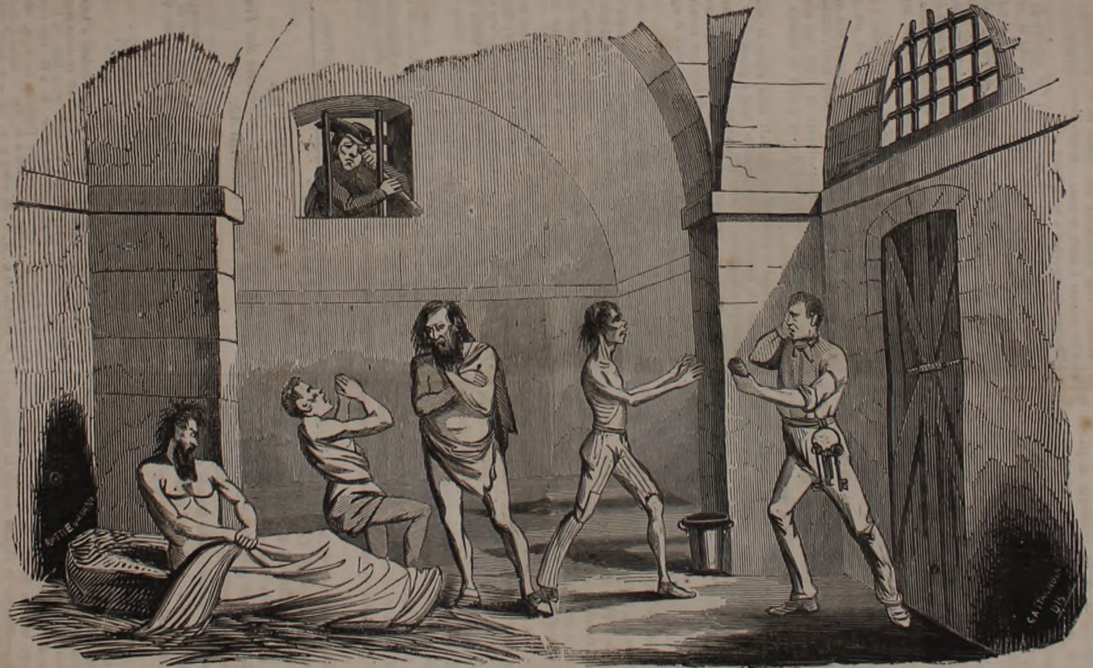
Condannati senza Processo che cantano il Salmo Expectans !!!