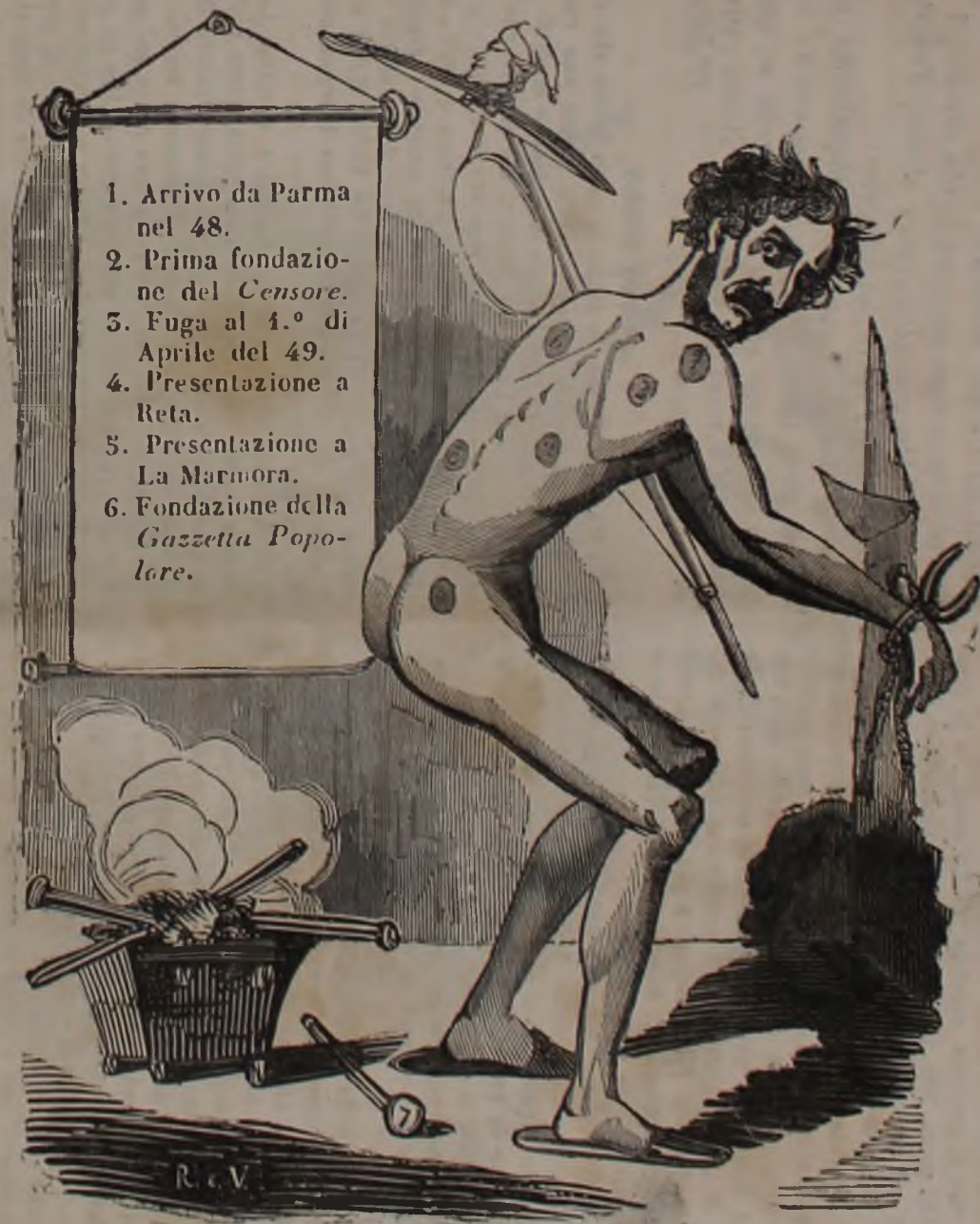
Il Torototella e la sua Biografia.