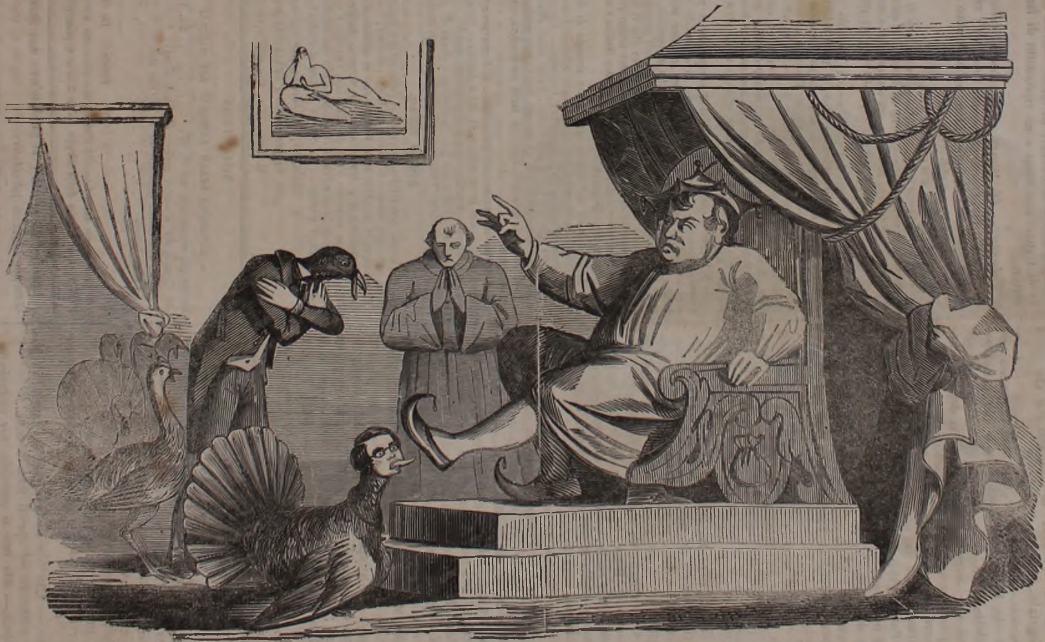
L' Ambasciatore della Mecca che si presenta al gran Cucù.