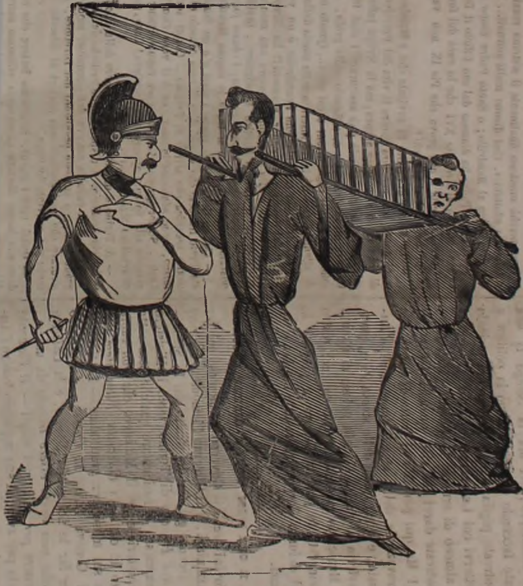
I becchiui Ministeriali guidati da San Martino si presentano colla bara per la sepoltura.