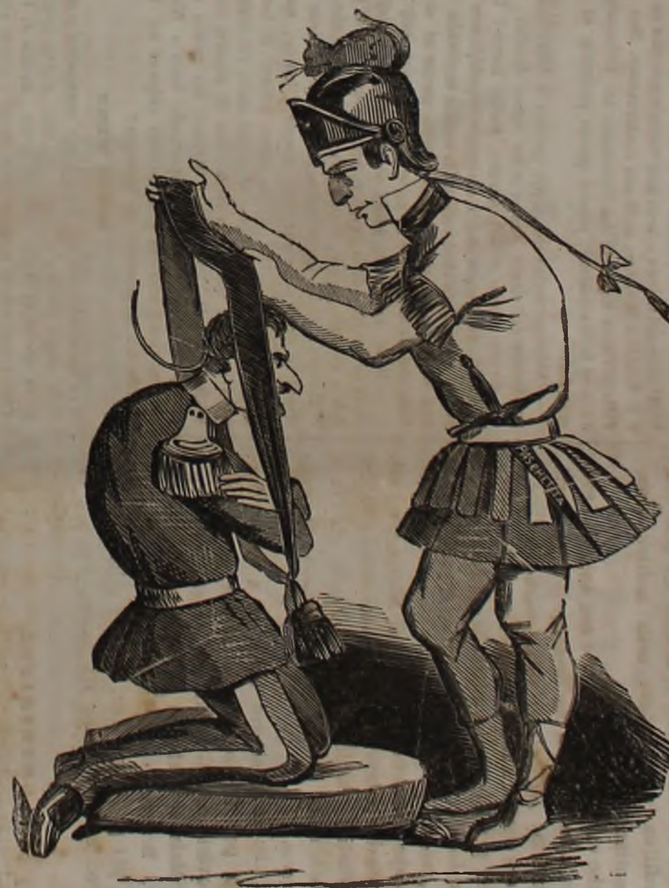
Le code si arricciano