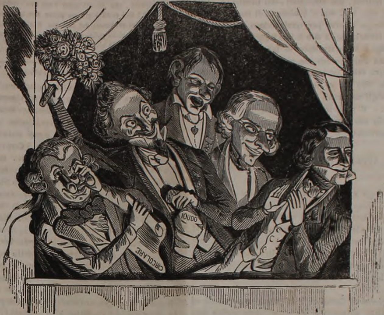
I Godini spargono fiori sul cammino del Generale Czarnoscki.