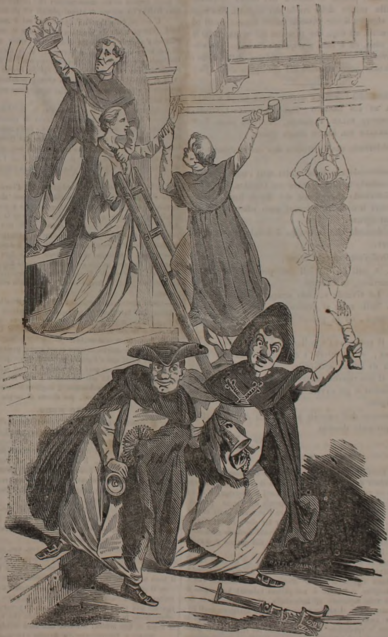
I Reverendi Padri Inquisitori d'Alessio rubano gli ori della Madonna per sottrarli dalle mani degli Empi .