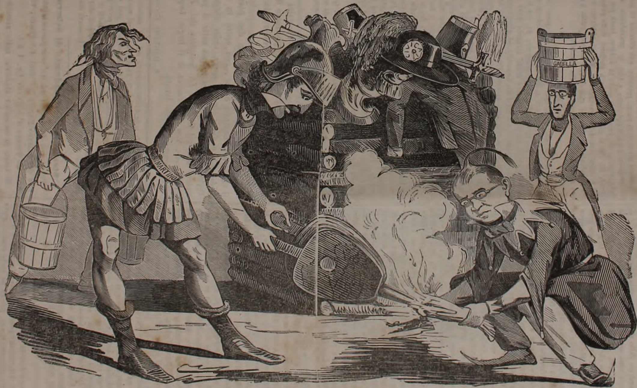
Nuovo Genere di Combustibili SPECIALI.