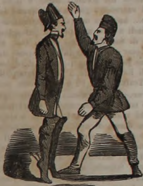
Il Socialismo magnetizza il Malaparte.