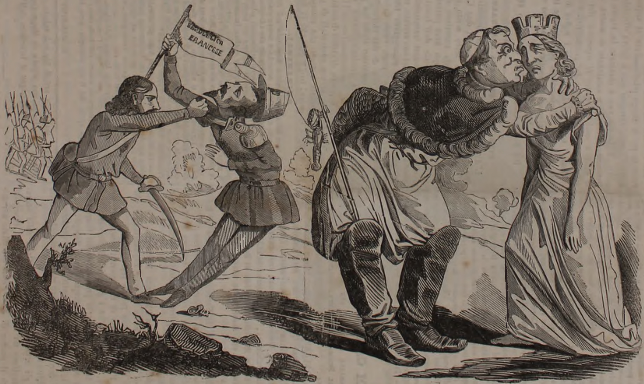
IL BACIO DI GIUDA.