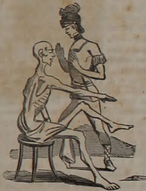
San Martino magnetizza lo Statuto.