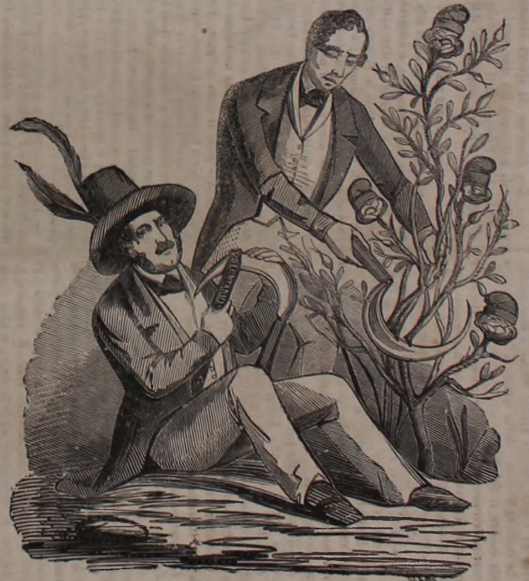
l'Ortolano Galvagno che recide le Rose ROSSE.