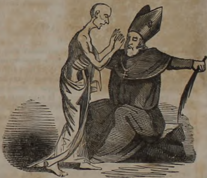
Lo Statuto magnetizza Fransoni.