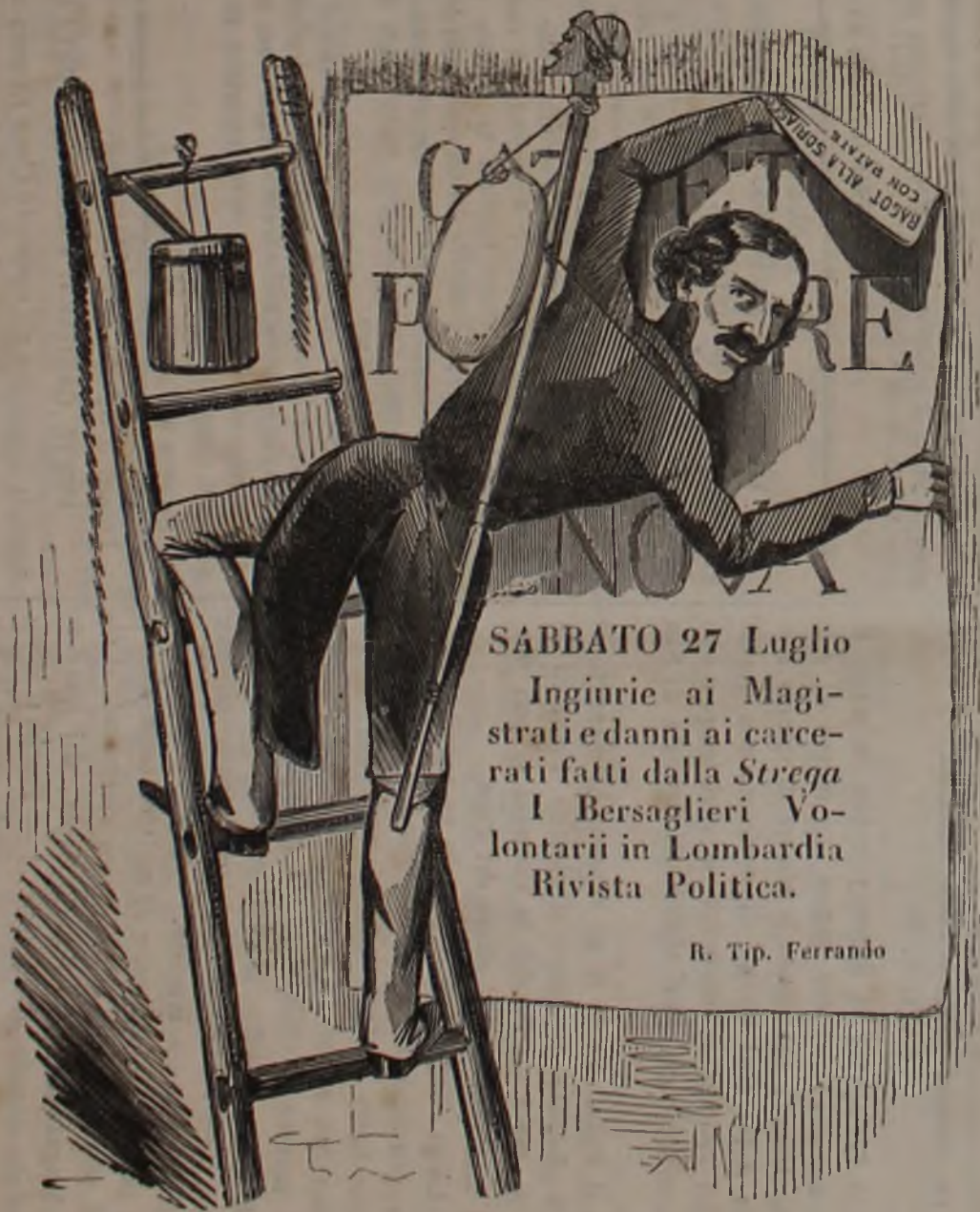
Il Torototella si appende sui muri.