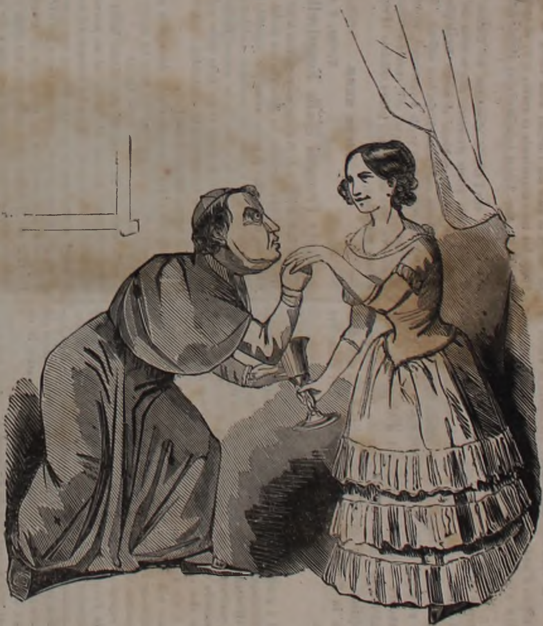
Franzoni che libra al Calice di Madama Spaur !!