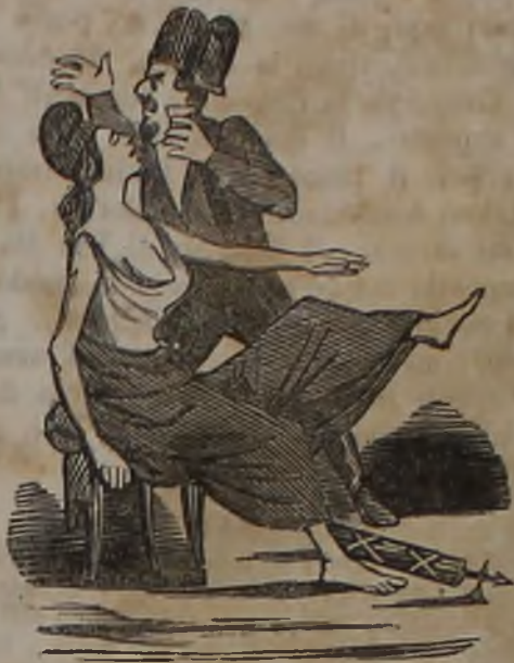
Il Malaparte magnetizza la Repubblica Francese.