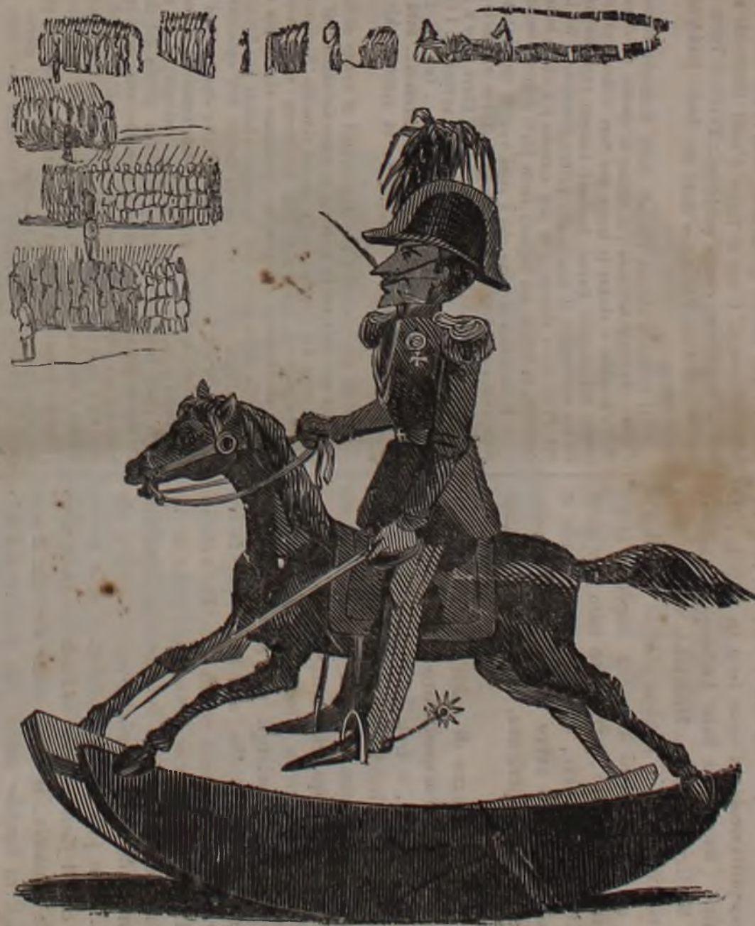
Gran Rivista della Guardia Nazionale di Genova!