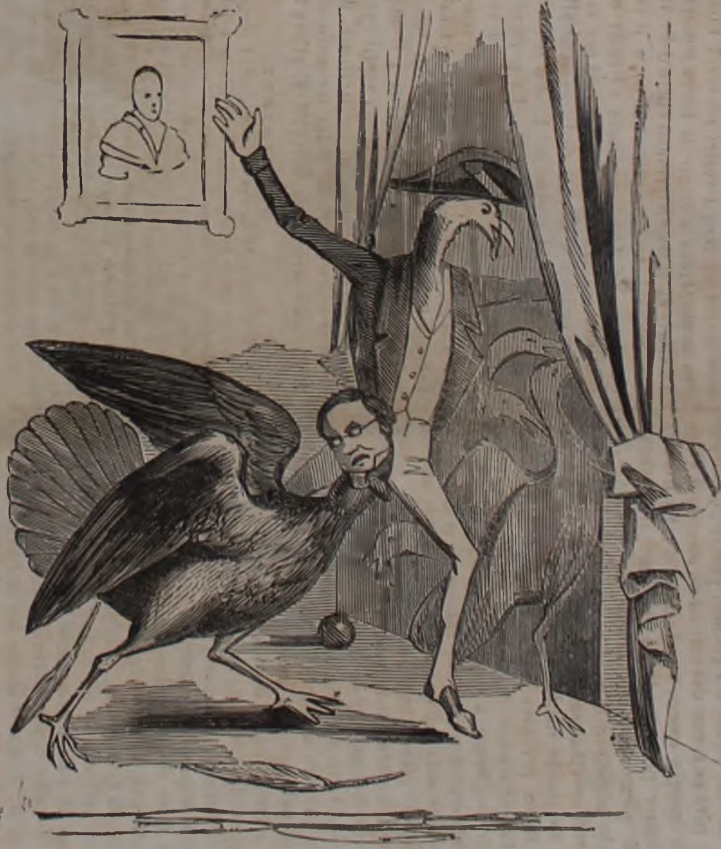
1 Capo dei Bonzi di Pekino scaccia a colpi di scopa gli impertinenti tacchini della Mecca ? che pretendono di avere il diritto di trattare con lui Diplomaticamente.