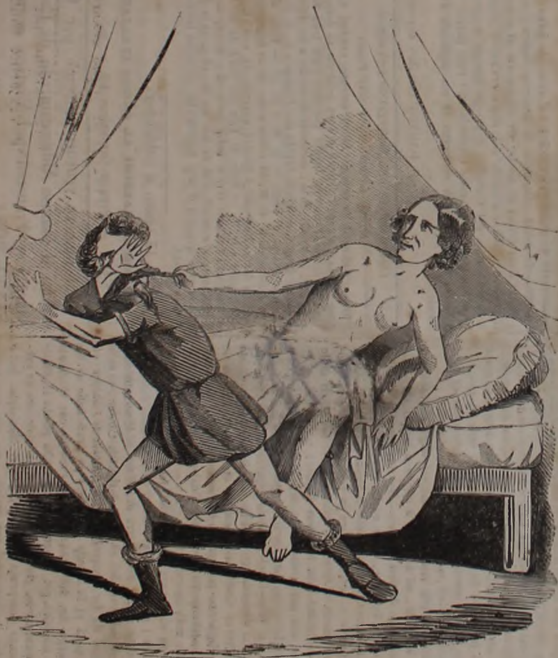
Castità di Giuseppe !!