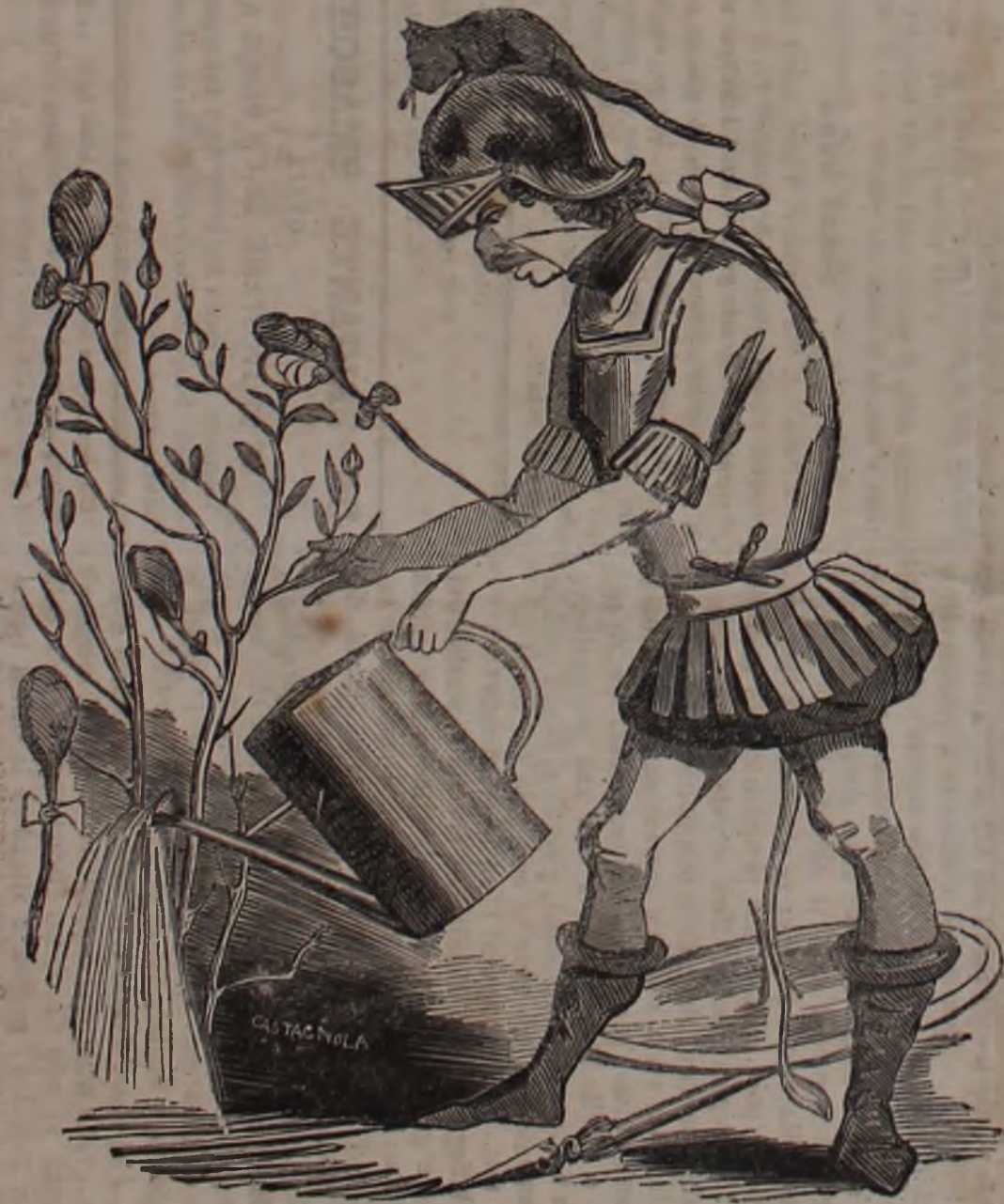
Il Giardiniere San Martino inaffia le Rose GIALLE.