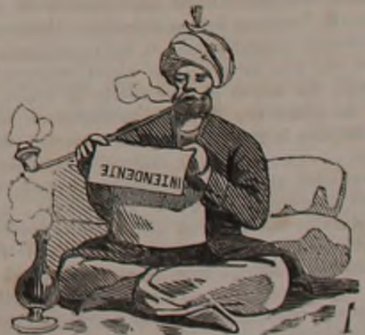
Gazzetta di Genova