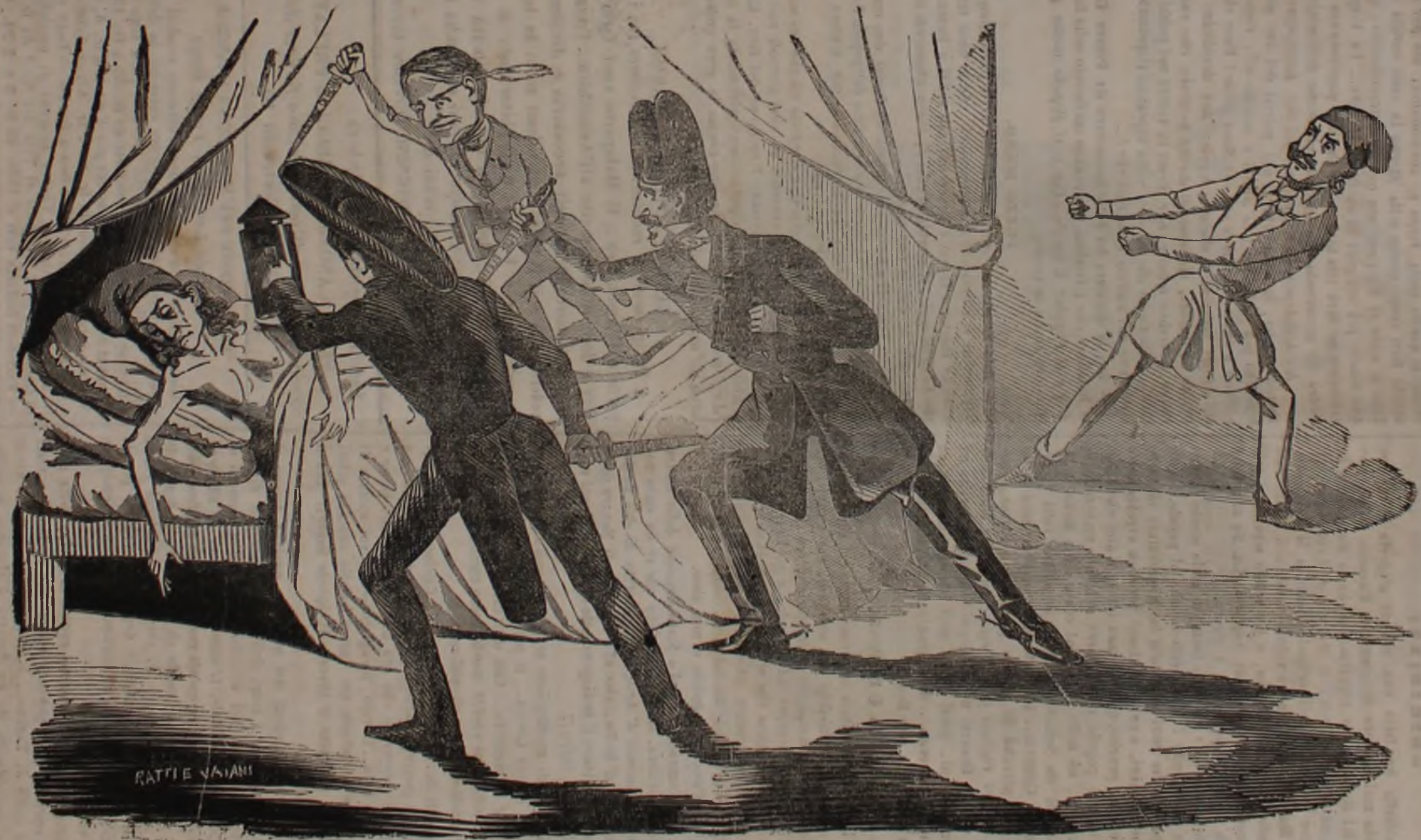
IL FAMOSO COLPO DI STATO IN FRANCIA.