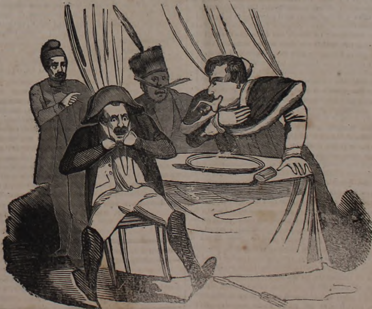
I due convitati presi da indigestione vomitano le pietanze ingoiate.