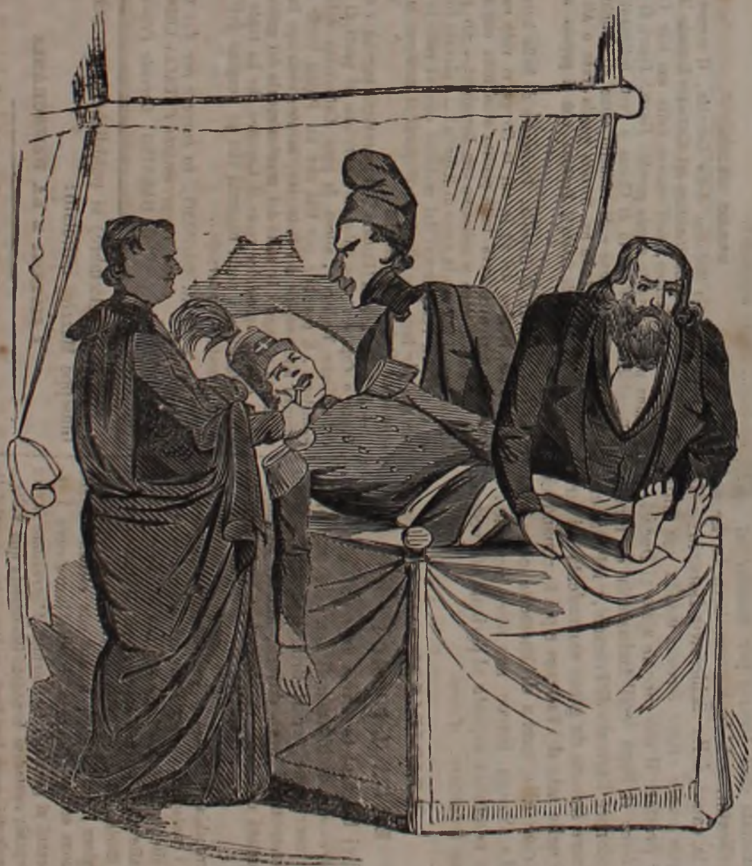
I Medici Asproni, Gavotti e Brofferio cercano invano di richiamare in vita la Guardia Nazionale di Genova morta d'apoplezia.