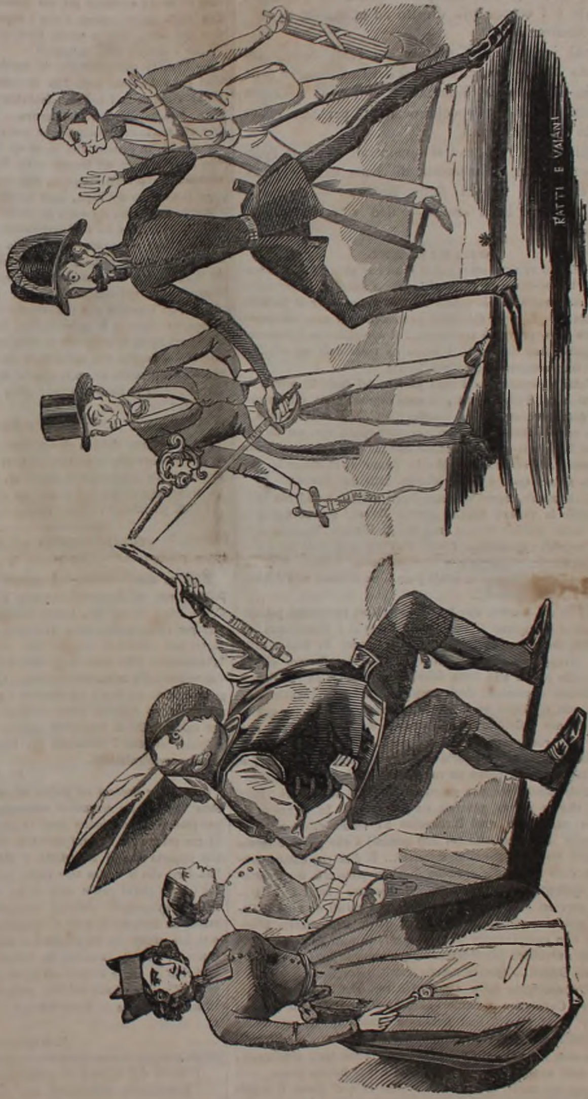
Un Duello ad armi disuguali. Chi vincerà?