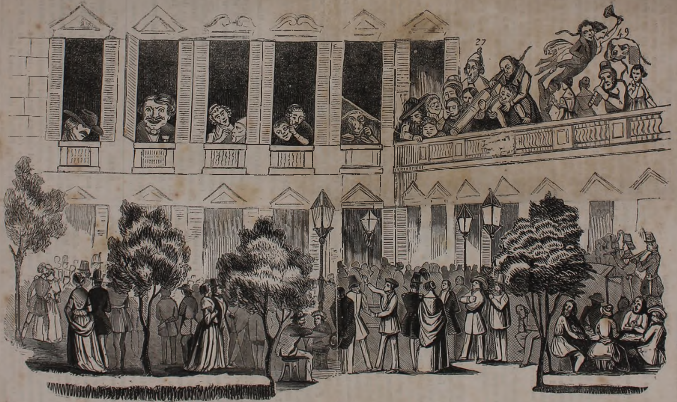
Veduta del Palazzo della Marchesana LUISA . . . . la sera della Festa alla CONCORDIA.