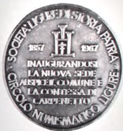
Medaglia commemorativa dell'inaugurazione della nuova sede della Società