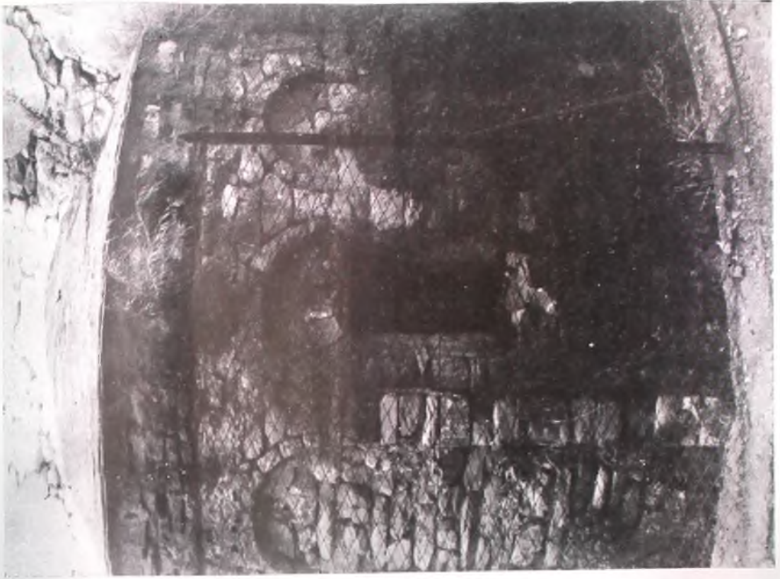
2. - Genova - Sampierdarena, Sant'Agostino della Cella: l'abside.