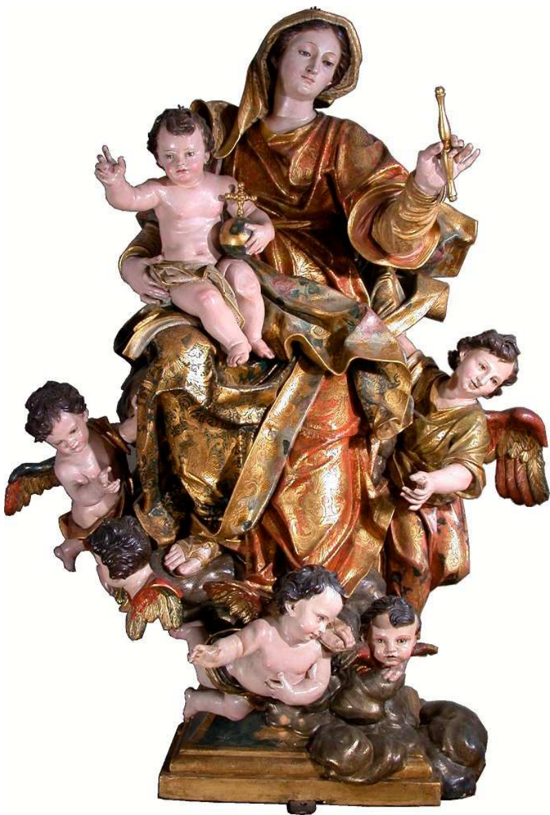
Figura 1 - A.M. Maragliano e bottega, Madonna Regina , Genova, parrocchia di San Gottardo.