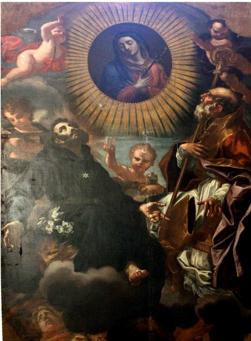
Figura 2 - Mulinareto, Santi in adorazione della Vergine , Recco, parrocchia dei SS. Giovanni Battista e Giovanni Bono.