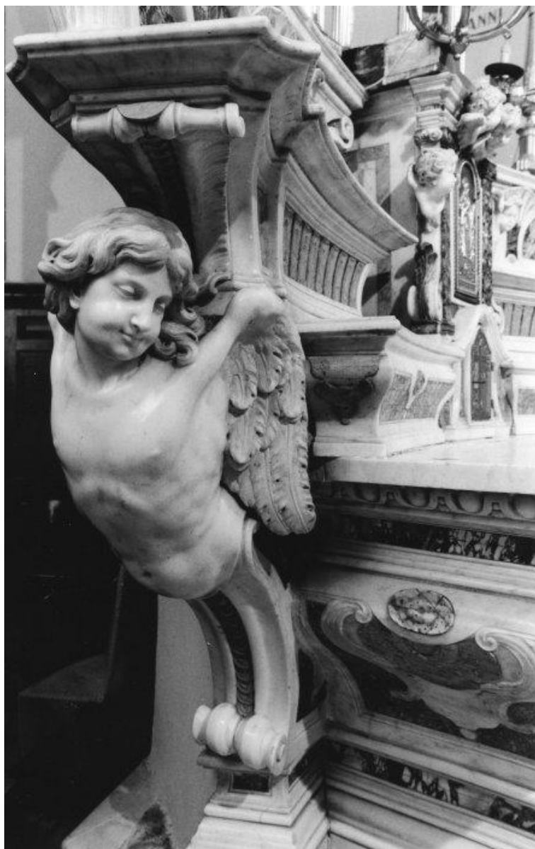
Fig. 4 - Pasquale Bocciardo, Altar maggiore, particolare . Ortovero, Chiesa parrocchiale di San Silvestro Papa.