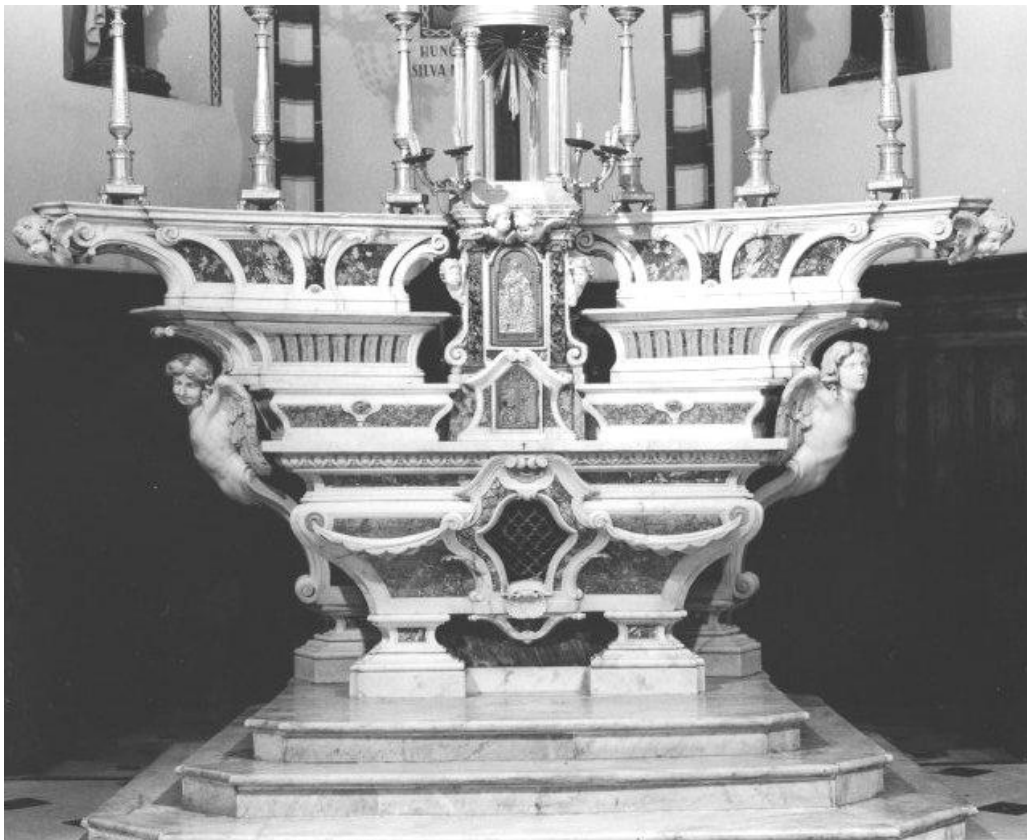
Fig. 3 - Pasquale Boccia, Altare maggiore . Ortovero, Chiesa parrocchiale di San Silvestro Papa.