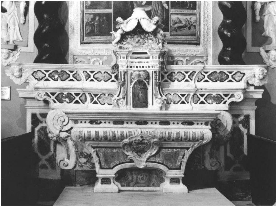
Fig.1 - Carlo Antonio Ripa, Altar maggiore . Ortovero, Oratorio di Santa Caterina.