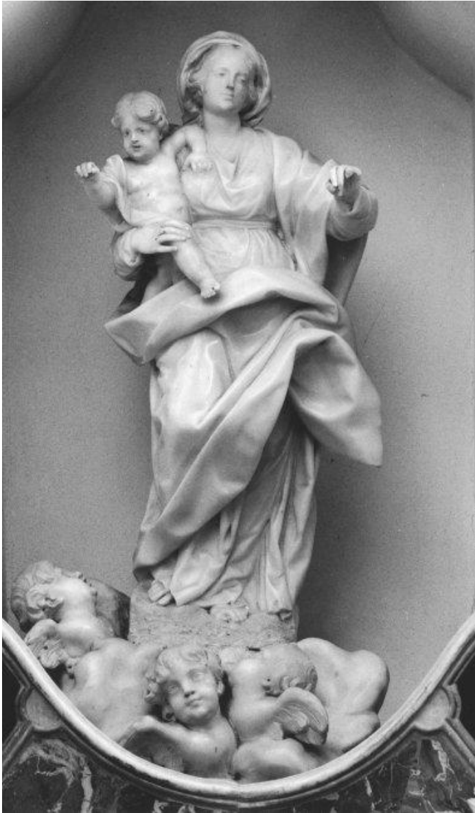
Fig. 7 - Pasquale Bocciardo, N.S. del Rosario . Ortovero, Chiesa parrocchiale di San Silvestro Papa.