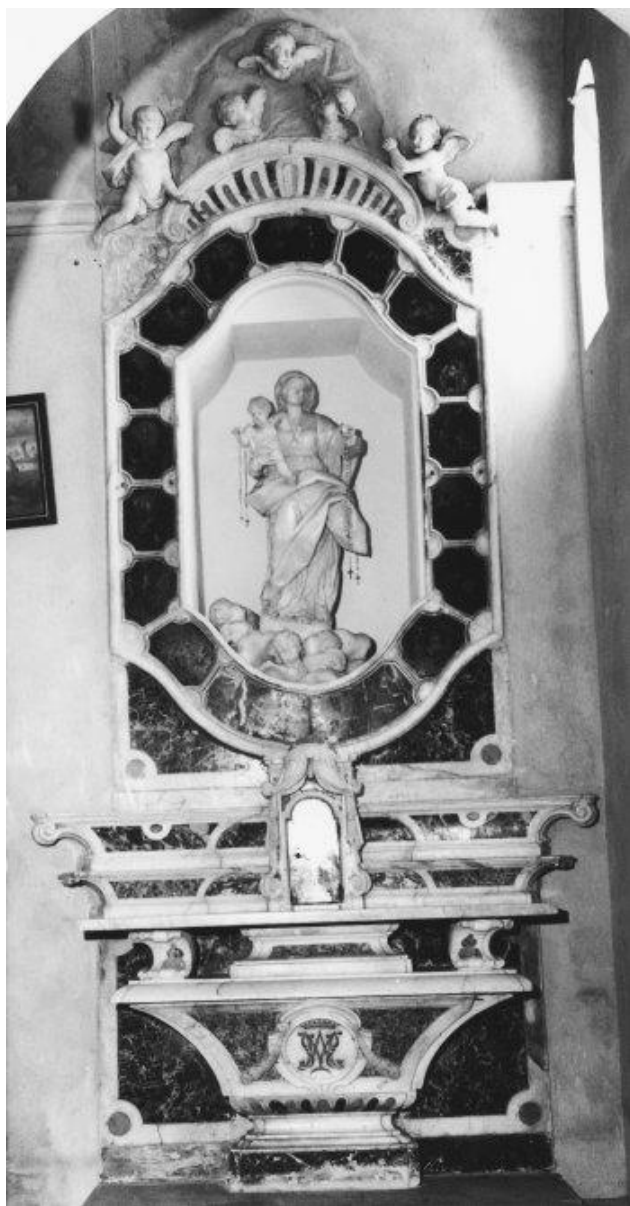
Fig. 6 - Pasquale Bocciano, Altare di N.S. del Rosario . Ortovero, Chiesa parrocchiale di San Silvestro Papa.