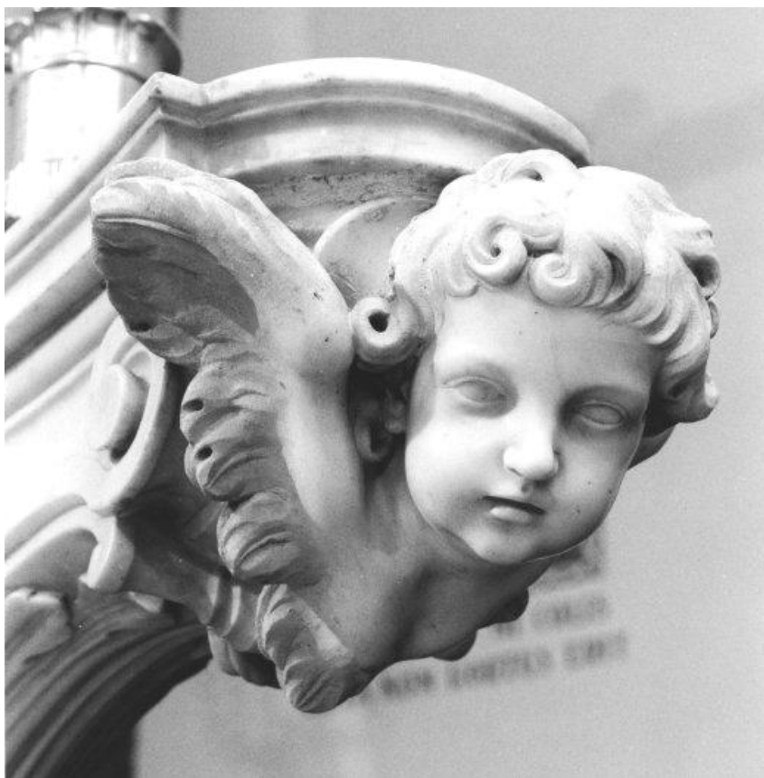
Fig. 5 - Pasquale Bocciardo, Altar maggiore, particolare . Ortovero, Chiesa parrocchiale di San Silvestro Papa.