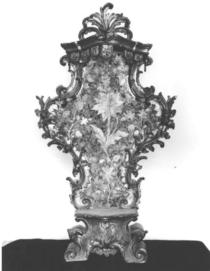
Fig. 2 - Trono per l'esposizione del Santissimo . Ortovero, Chiesa parrocchiale di San Silvestro Papa.