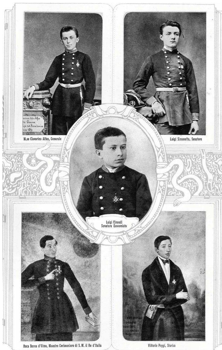
Fig. 1 bis - I «Principi dell'Accademia» più noti dell'Istituto dei P.P. Scolopi di Savona, da Reale Collegio Scuole Pie Savona, Genova s.d.

Il ritratto di Vittorio Poggi (olio su tela, coll. privata) era stato dipinto nel 1849 da Angelo Oxilia (AP, I 11, c. 28 v.).