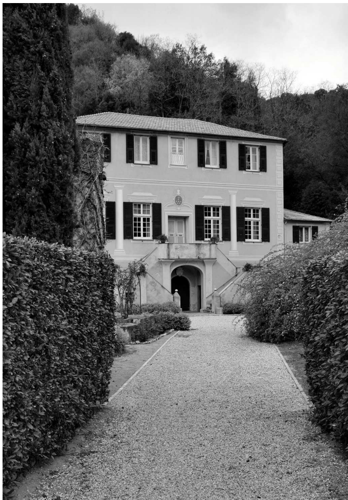
Fig. 7 - La Pace .