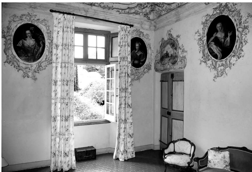
Figg. 8-9 - La Pace . Salottino con decorazioni rococò e medaglion con ritratti di donne della famiglia.