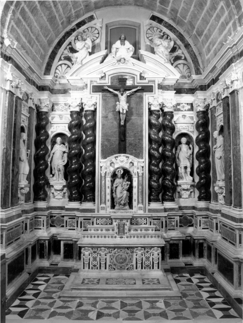
Cádiz, Catedral Vieja. Capilla de la Nación Genovesa.