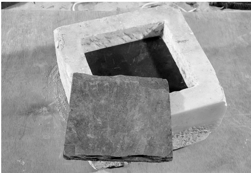
Cádiz, Catedral Vieja. Capilla de la Nación Genovesa. Primera piedra y placa de cobre con la inscripción.